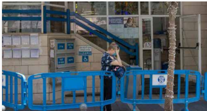
סניף ביטוח לאומי בירושלים, בספטמבר. רוצות לצאת לפנסיה בכבוד

אלפי נשים מוחלשות ייפגעו מהעלאת גיל הפרישה: "לא יודעות איך נחזיק מעמד"