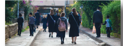
ילדים הולכים לבית הספר בבני ברק, בשנה שעברה. בשנה הראשונה פעלו 16 בתי ספר ממלכתיים-חרדיים, חיסם פועלים 70 אצלם: ניל קידר

חינוך וחיברה משרד החינוך יחייב רשויות מקומיות להקים בתי ספר ממלכתיים-חרדיים במסמך רשמי שמכיר לראשונה בורם החינוכי שהוקם לפני כעשור נכתב כי ההורים יוכלו לדרוש את הקמת בתי הספר ולקבל מימון להסעות עבור ילדיהם. עד כה נתקלו ההורים בהתנגדויות מצד הרשויות וגורמים פוליטיים חרדיים