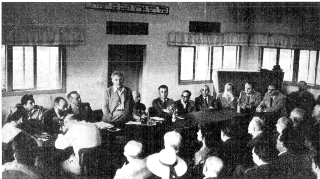
בעצרת הסוֹטְרִים למען הקרן הקימת לישראל. תשרי תש"ד.