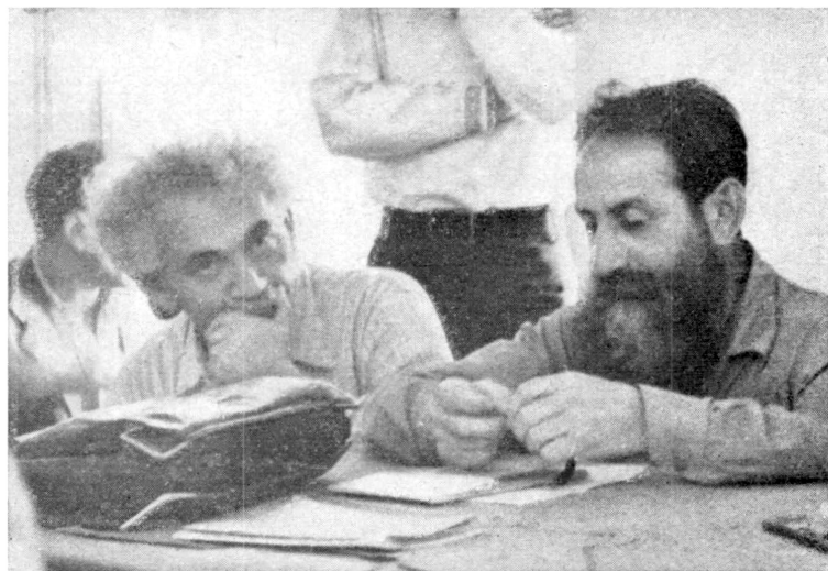
בירחהעיון ברחובות, אדר תש"א