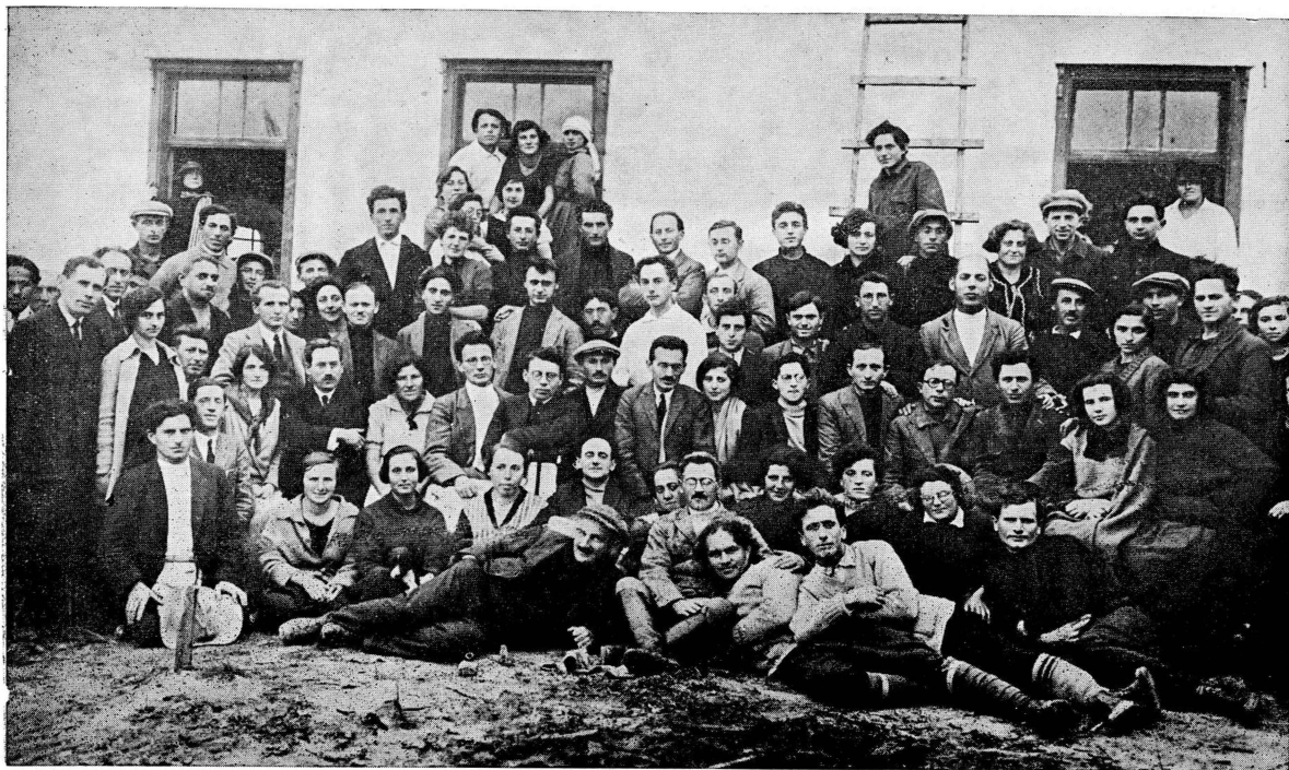
מועצת „אחדות העבודה“ בנחלת יהודה, סבת תרפ"ה